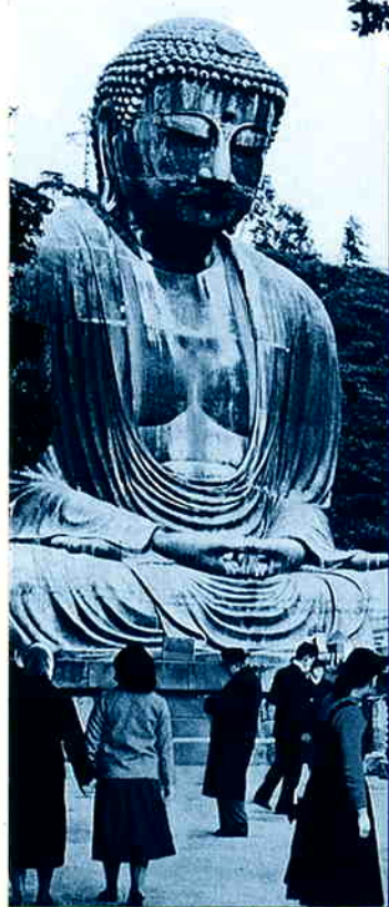
鎌倉大仏 (鎌倉市長谷)